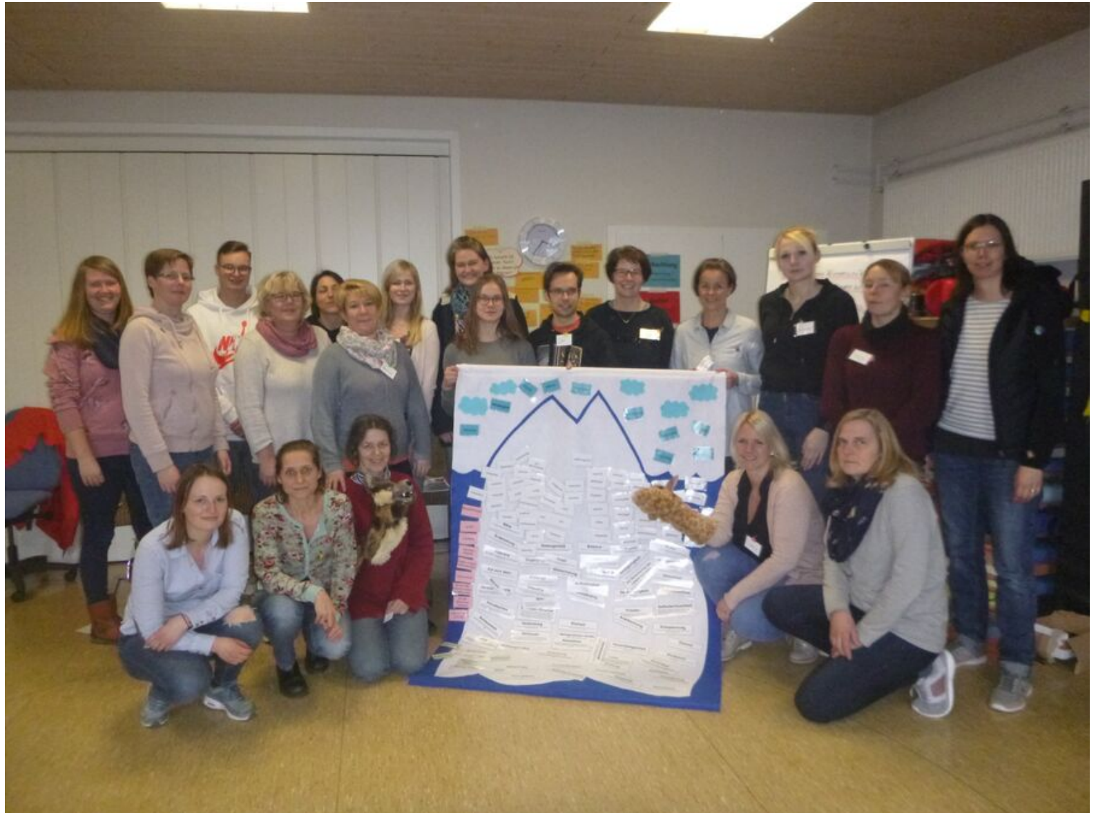
Erzieherinnen und Erzieher des Familienzentrum Eggenest nahmen kürzlich an einer Teamfortbildung zum Thema „Kommunikation“ teil.